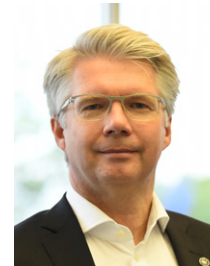
Dirk Reusch Automobil Produktion