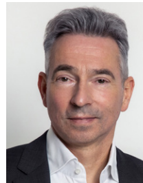
Olaf Jelken Agamus Consult