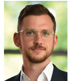
Pascal Nagel Automobil Produktion